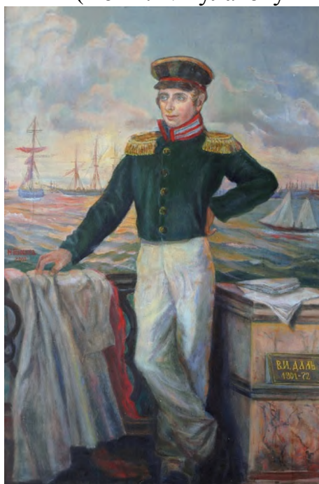
Н.А. Генкина. Портрет В.И. Даля (2000 г.)

(По М.А. Булатову и В.И. Порудоминскому)