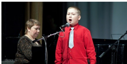
2. Детский хор