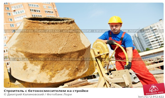
Строитель с бетономесителем на стройке